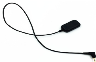
mini GPS logger