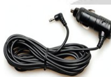
cavo di alimentazione per presa accendisigari 12/24 V DC