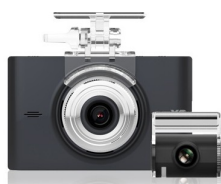
telecamera anteriore, telecamera posteriore (e relativi supporti con biadesivo)